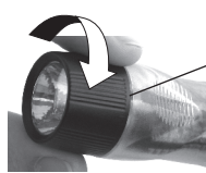
Figure 1 – Switch Operation Opération de commutation Schalterbetätigung

Unlock the safety lock by sliding the lock button forward. Rotate the switch to the off position and pull the switch lock back to lock the switch and prevent accidental activation while in transit.